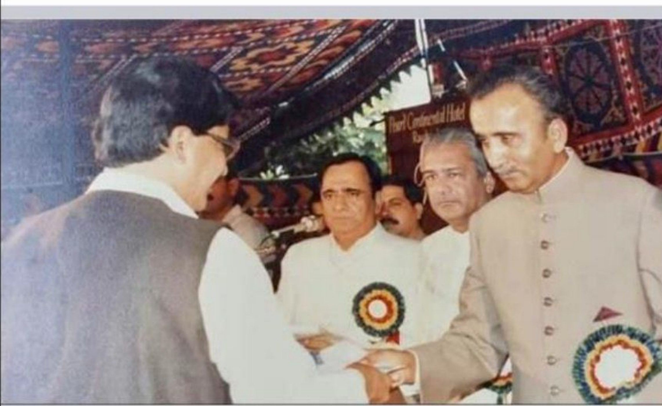
محمد سلیم احسن وزیراعظم پاکستان محمد خان جونيجو سے خواجہ غلام فرید قومی ایوارڈ وصول کرتے ہوئے۔ (-)